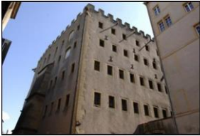
Le fabuleux grenier de Choroent, le plus grand qui subsiste en Europe avec celui des Antonins, lui aussi à Metz

Au treizième et quatorzième siècle, la ville de Metz prospérait dans le commerce des textiles, draps, tapis, des céréales et des vins, Les greniers de la ville (figure 1), probablement les plus grands d'Europe en attestent encore aujourd'hui. La vallée de Moselle riche terre agricole produisait le blé et les côtes tout autour de Metz produisaient en quantité le vin de Moselle. Le vin gris était véhiculé sur la Moselle et était vendu dans les pays du nord, Allemagne, Pays Bas, Angleterre, et jusqu'en Ecosse